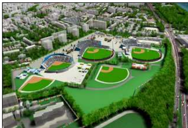
Maquette du site de Colombes 2012

On ne sait pas encore qui va organiser Les jeux olympiques 2012 mais Londres, Madrid, New York et Paris sont les favorites.